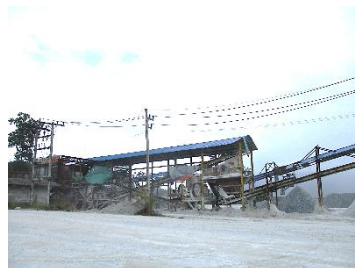
โรงแต่งแร่ของโครงการ