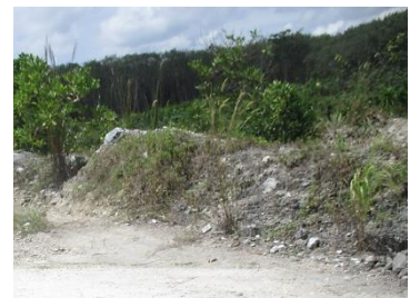
กองเปลือกหิน/ดิน