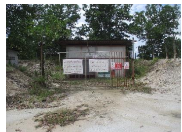
อาคารเก็บวัตถุระเบิด