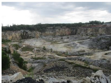
พื้นที่หน้าเหมือง