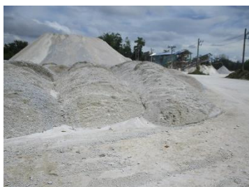
ลานเก็บกองแร่