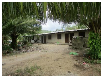
บ้านพักพนักงาน